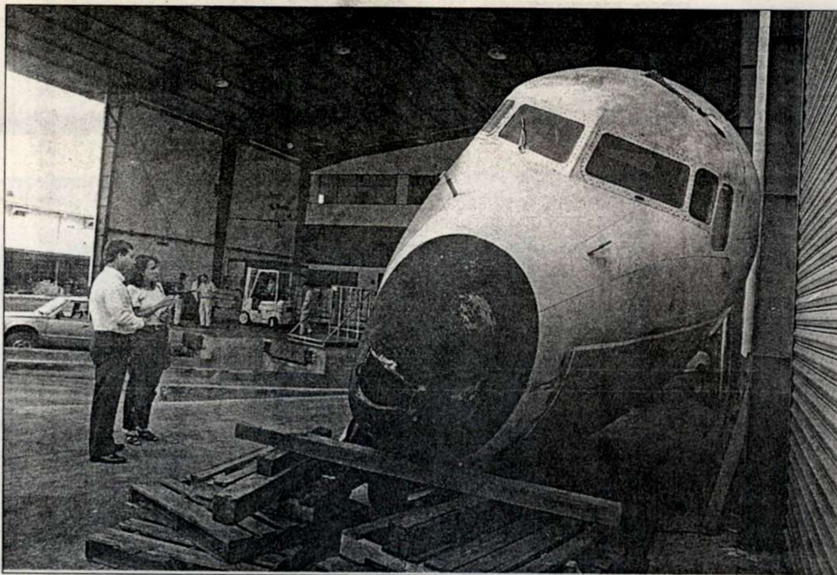
La parte delantera de este cuatrimotor DC-6 construido aproximadamente en 1950, es una de las muchas piezas con que contará el Museo Aeronáutico de Costa Rica.

A la vez, con este museo se quiere rendir un homenaje a los pioneros de la aviación costarricense, como Tobías Bolaños Palma (1891-1953), primer aviador del país. Le siguió Román Macaya, quien tras estudiar aviación en California, Estados Unidos, regresó a Costa Rica volando en la aeronave llamada Espíritu Tico ; posteriormente creó la primera aerolínea de Costa Rica: Aerovías Nacionales.